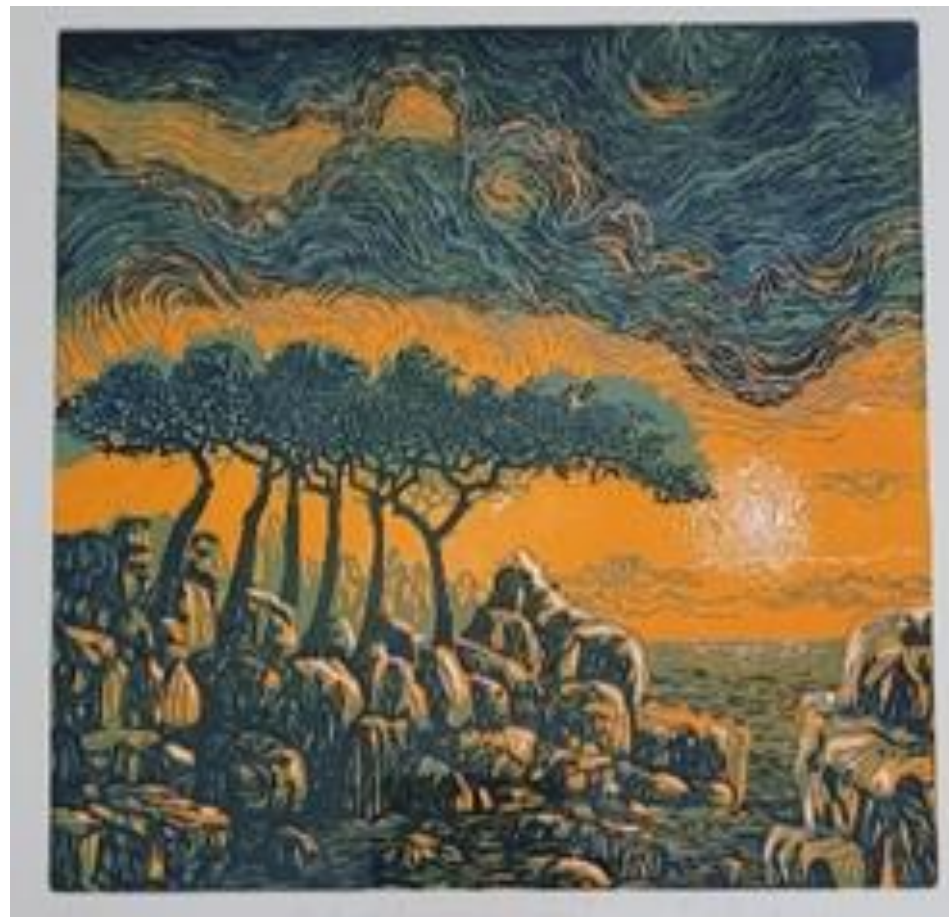
Non lo vedi il mio viso farsi brace? – cromoxilografia - 70 x 50 cm