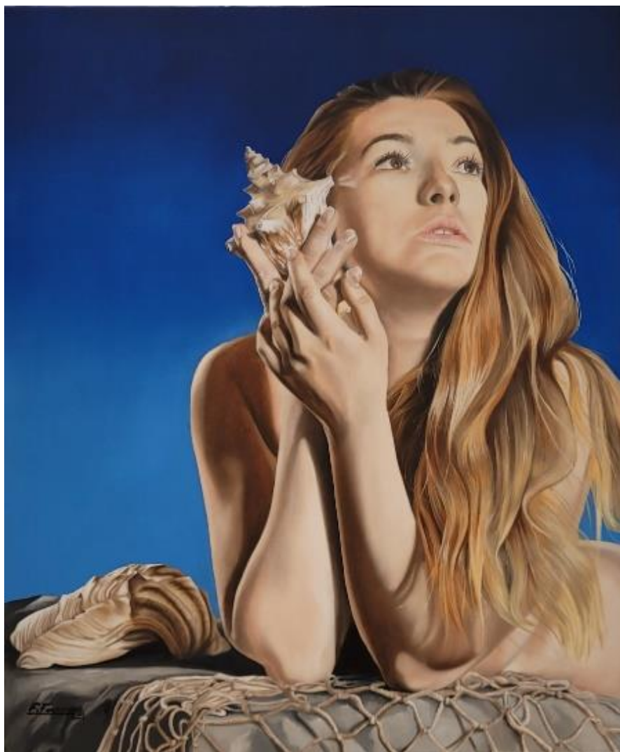
Sirena - olio su tela 50x70 cm