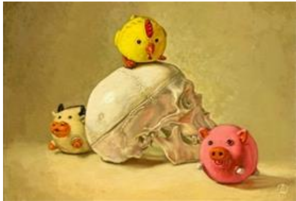
Rivincita - Tempera all'uovo su tavola 35 x 50 cm