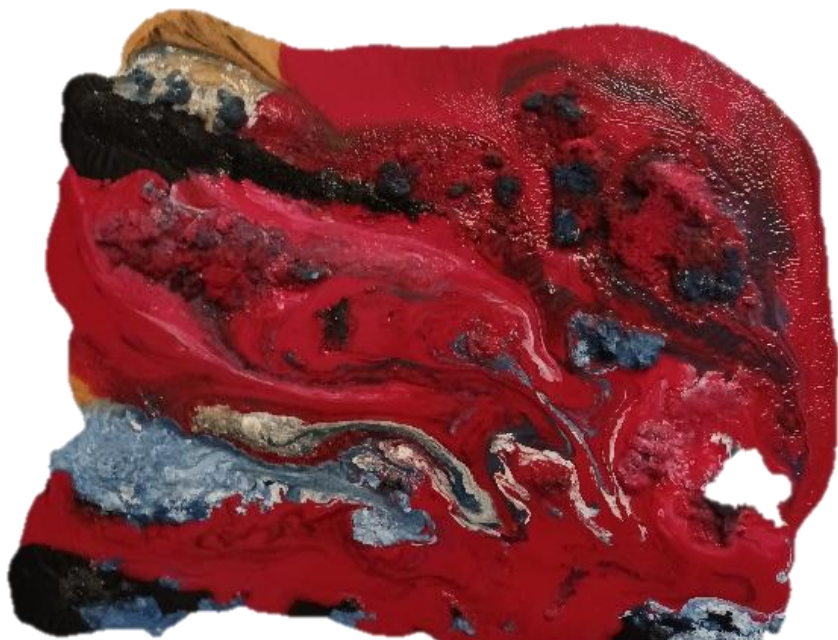
Magma , tecnica materica su tela 50 x 60 cm