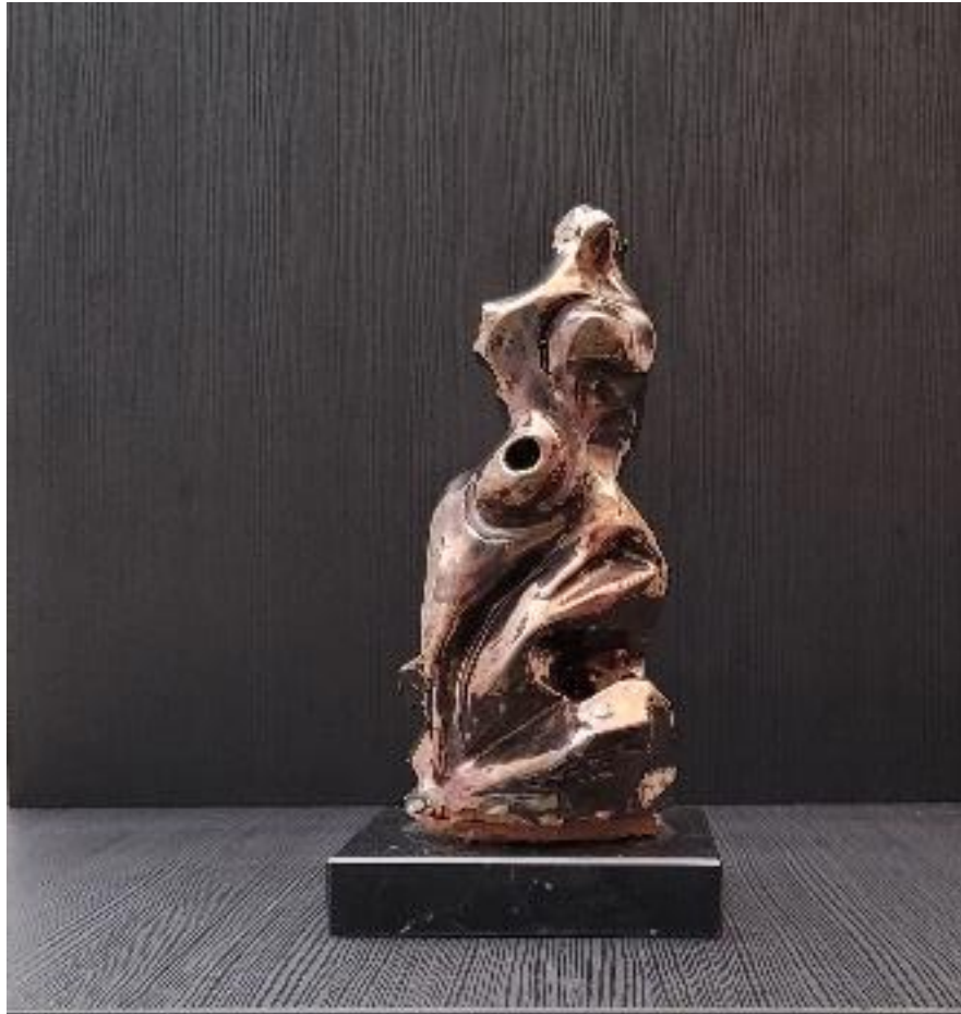
Avvolgersi – scultura in ceramica