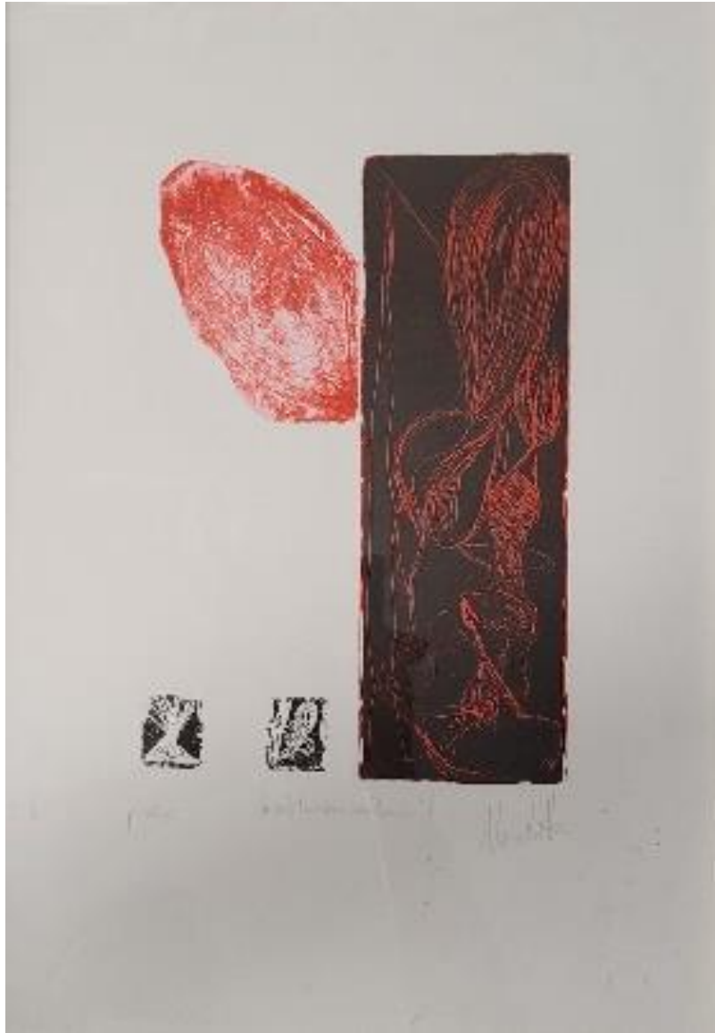
Se solo tu potessi ascoltarmi – acquaforte e acquatinta 50 x 35 cm