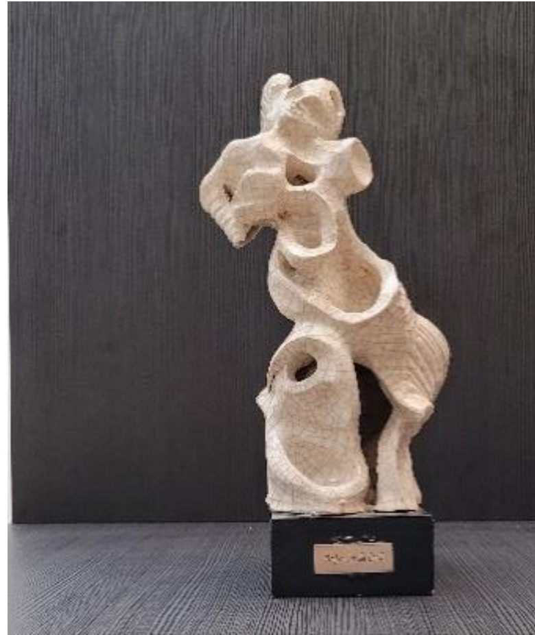
Fuori dagli schemi - scultura in ceramica