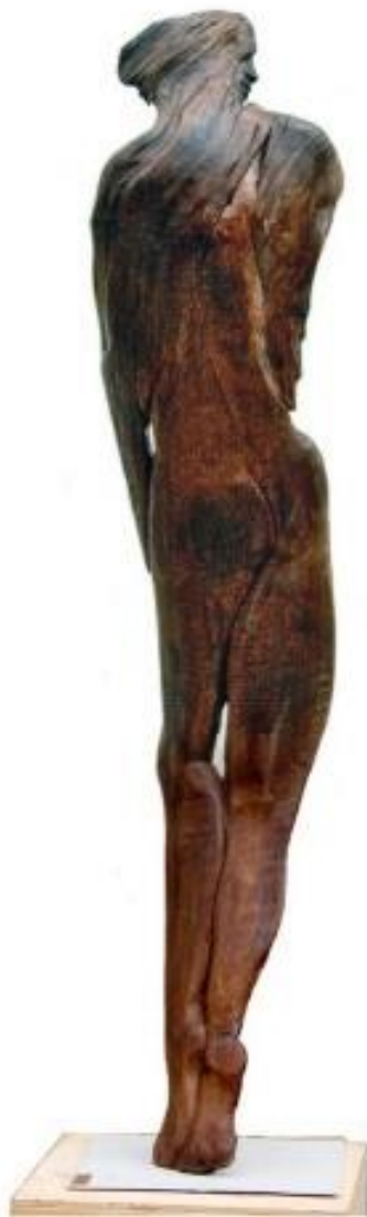
La Satarcangelese – scultura in legno 38x38x150 cm