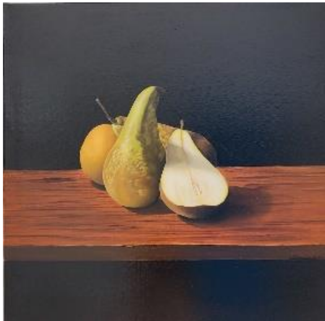
Natura morta – olio su tela 40 x 40 cm