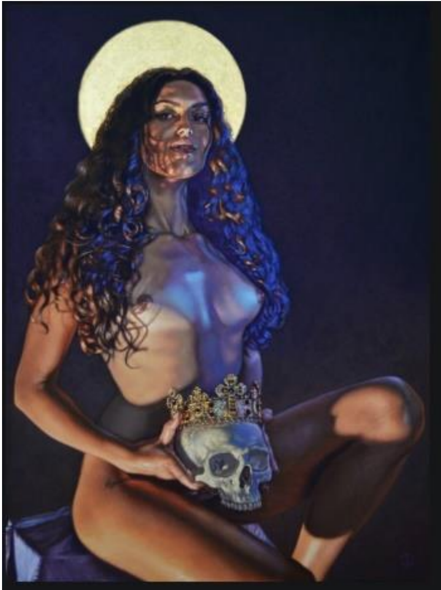
Parthenope - Olio e foglia d'oro su tela 80 x 110 cm