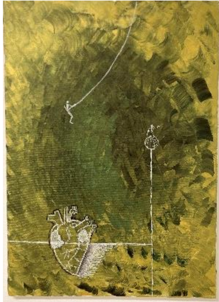
Il subconscio, il potere e la libertà - Acrilico su tela 50x70 cm