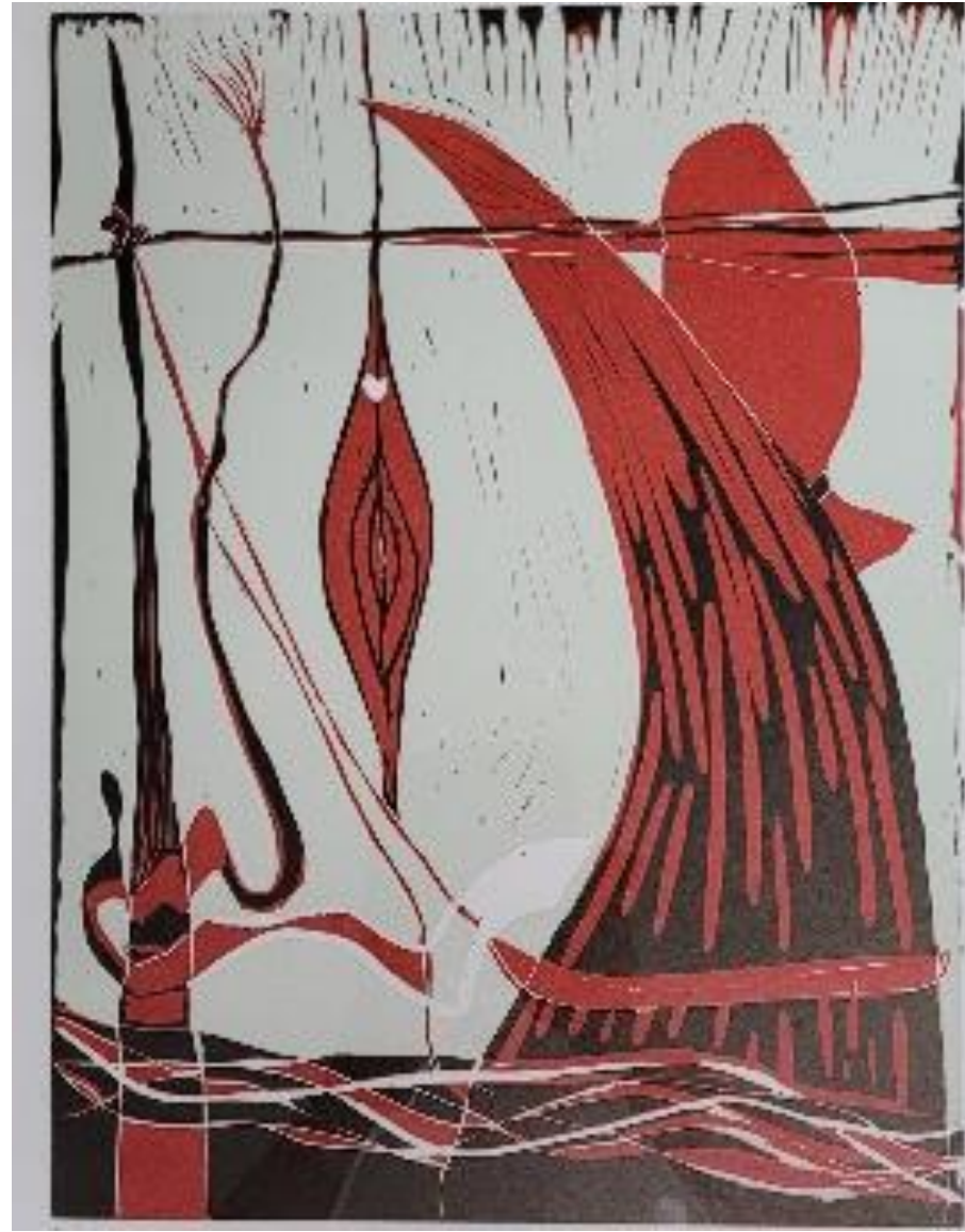
Più in là – linoleografia a matrice persa