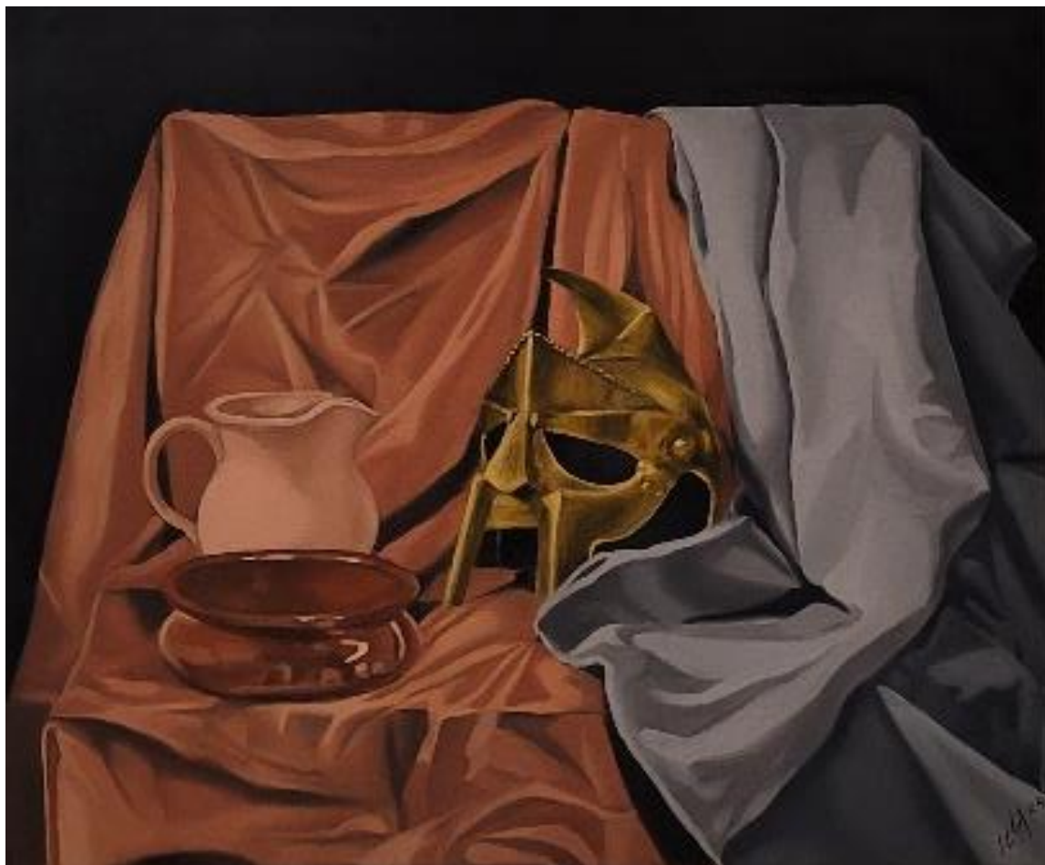
Il riposo del guerriero - olio su tela 50x60 cm