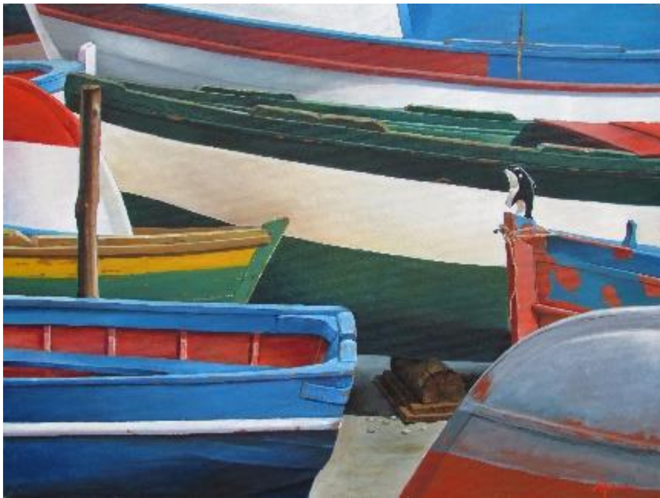
Barche – olio su tela 70 x 50 cm