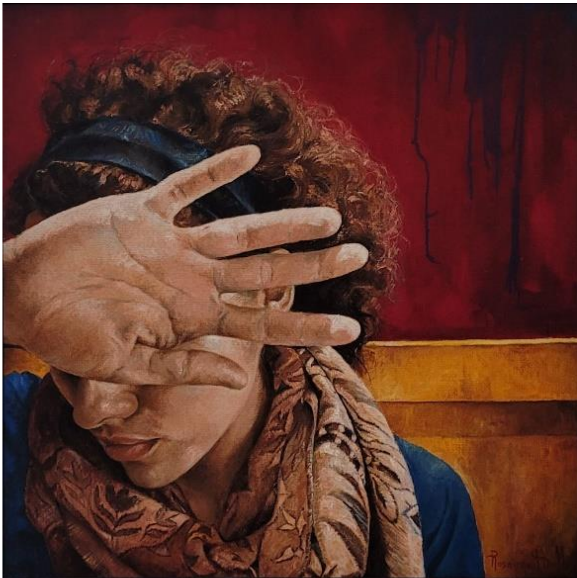
Reflusso di coscienza – olio su tela 60x60