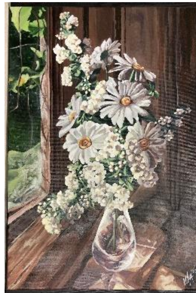
Vaso con fiori - acrilico su tela