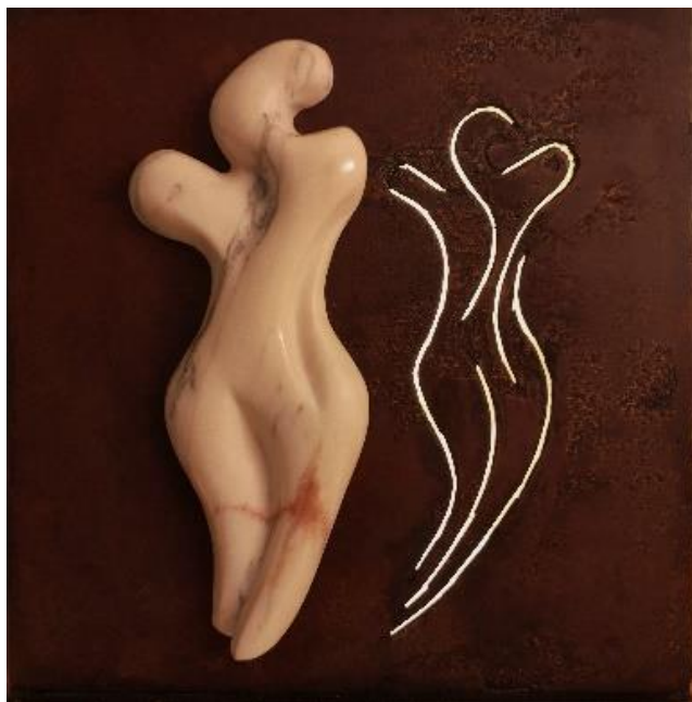
Tracce di sé – scultura in marmo 50 x 50 cm