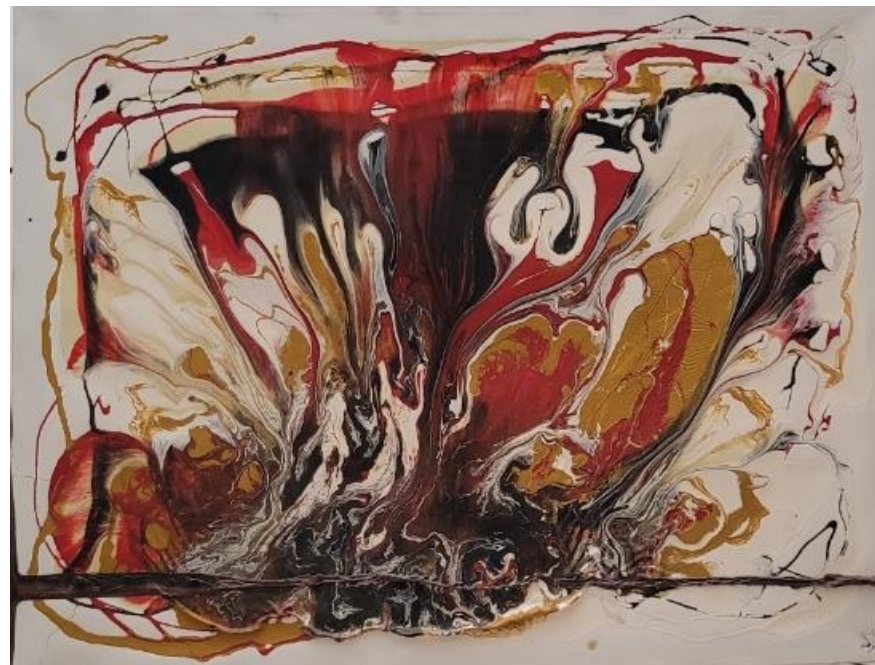
Fuoco sacro - tela smalto ad olio su tela 60 x 80 cm