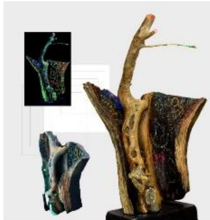
Racconti - scultura in legno