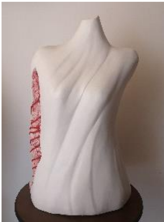
Libera di essere – scultura in gesso e corda di nylon 70X42X20 cm