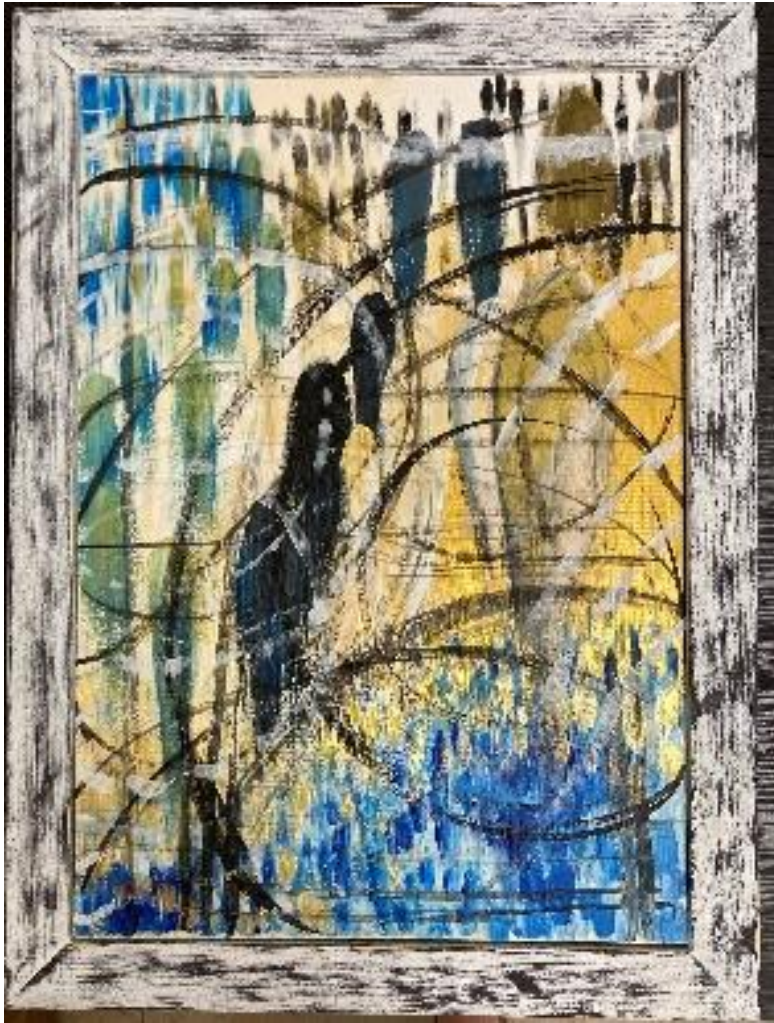
Trasmutazione - acrilico su pannello telato 50x35 cm